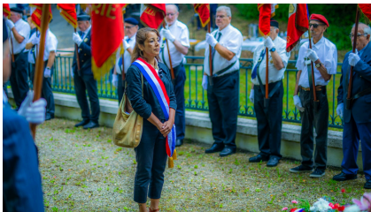
Cérémonie d'hommage aux résistants à Beauvoir-en-Royans