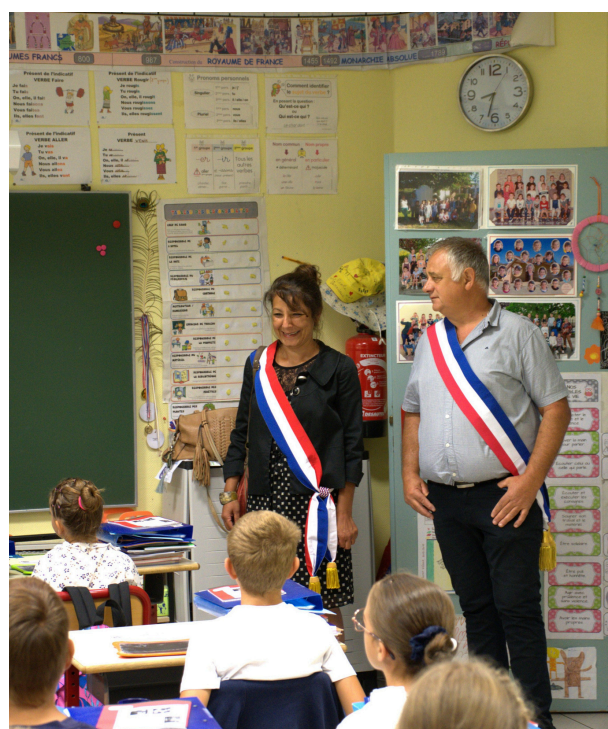
Rentrée des classes à Varacieux

J'ai également engagé un tour d'horizon de la prise en charge des enfants sur notre territoire. Mon mandat m'a donné l'opportunité, entre autres, de participer à la rentrée scolaire de l'école de Varacieux, de rencontrer le proviseur du collège de St Marcellin, d'être présente à l'inauguration de divers établissements ou équipements scolaires ou encore, très récemment, de partager un déjeuner au sein de la restauration scolaire de l'école d'Auberives-en-Royans. Si j'ai rencontré des équipes engagées et découvert des initiatives encourageantes comme l'École de la 2ème Chance à Voiron ou la Pépinière des talents à Moirans pour n'en citer que quelques-unes, les obstacles à la mobilité en pays Voironnais et dans le sud grésivaudan, le manque de moyens alloués, le parcours du combattant d'accès à l'enseignement des élèves et étudiants en situation de handicap, affaiblissent toujours plus le service public de l'éducation et la prise en charge de nos jeunes.