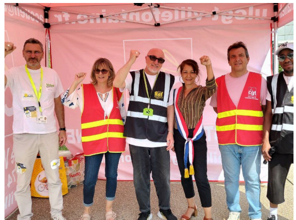
Déplacement en soutien aux grévistes de Valéo à Saint-Quentin-Fallavier

Vos combats remontent jusqu'à l'Assemblée nationale, où j'ai interrogé plusieurs ministres et dirigeant.es d'entreprises, sur la fermeture des sites industriels, comme ceux de Vencorex et de Valéo, sur le territoire isérois, sur le mal logement, sur la situation des agriculteur.trices ou encore sur la précarité énergétique. Je continuerai à porter vos voix à l'Assemblée.