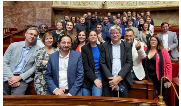
Photo de groupe après une soirée de lutte en hémicycle

Nous avons bataillé lors de l'examen du projet de loi de finance, en faisant adopter un texte en cohérence avec le programme du Nouveau Front Populaire. Un 49-3 a empêché cette adoption, mais nous allons continuer de mener le combat et de répondre aux urgences sociales et climatiques.