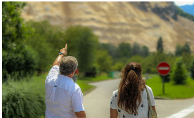
Visite sur les lieux de l'éboulement à La Rivière