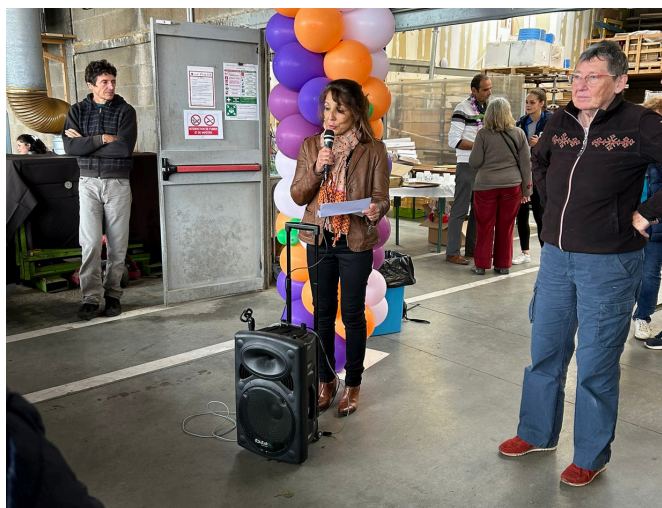
30 ans de l'association Passiflore à Tullins

Des secteurs fondamentaux de notre quotidien sont pris en charge par des associations. Feeling, pour la lutte contre les injustices liées au genre, le Pic-Vert et son incontournable engagement pour la préservation de notre biodiversité, le soutien aux plus fragilisés.es que permet Passiflore, l'accès à l'emploi par un modèle solidaire et écologique qu'insuffle Tero Loko. J'ai voulu rencontrer ce monde associatif et je continuerai de m'investir en soutenant ces associations qui oeuvrent pour le bien commun. Aussi, je compte organiser un atelier des lois pour que celles et ceux qui font vivre ce monde associatif puissent traduire leurs besoins en une véritable proposition de loi.