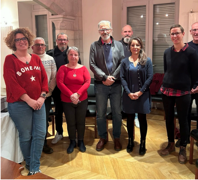
Réunion avec l'équipe municipale d'Izeaux

J'ai souhaité rencontrer les équipes municipales des communes de ma circonscription car ce sont elles qui sont le plus souvent au contact des problématiques quotidiennes de nos concitoyen.es. Je suis également convaincue qu'il ne pourra pas y avoir de planification écologique sans s'appuyer sur l'échelle de la commune.