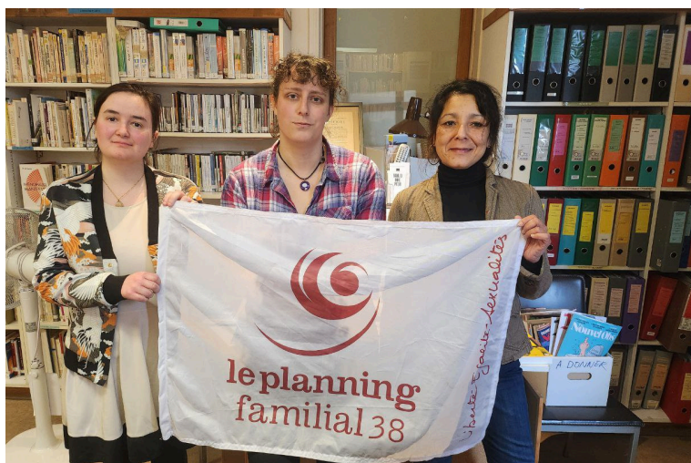
Rencontre avec le planning familial 38

J'ai à cœur également de lutter pour les droits des femmes, de lutter pour l'égalité des genres, que cela soit au niveau de l'Assemblée nationale ou bien de la circonscription. En 2024, la France est devenue le premier État à constitutionnaliser l'IVG grâce à la France Insoumise. Mais en 2024 aussi, l'affaire Pélicot nous a rappelé que cette société machiste et patriarcale doit radicalement changer. C'est en ce sens que je continuerai à me mobiliser comme je l'ai fait jusqu'à présent : en rencontrant le planning familial, en faisant l'ouverture du Festival Puissant.es, en recevant à ma permanence parlementaire.