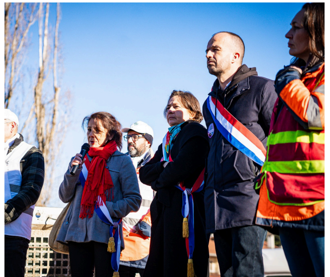
Discours sur le piquet de grève des salariés de Vencorex

Le début de mon mandat s'est inscrit dans un contexte national de crise économique, marqué par de nombreux plans de licenciement sur des sites industriels. La faute à des années de politiques libérales où les gouvernements ont arrosé les grandes entreprises d'aides sans contreparties. Vencorex, Photowatt, Valéo, Team Tex ou encore DS Smith sont autant de sites industriels aujourd'hui menacés. À chaque fois, je suis allée rencontrer les salarié.es, les soutenir sur leur piquet de grève et utiliser tous les moyens à ma disposition pour appuyer leur lutte. C'est dans cet état d'esprit que je vais continuer mon mandat en faisant remonter ces combats à l'Assemblée.