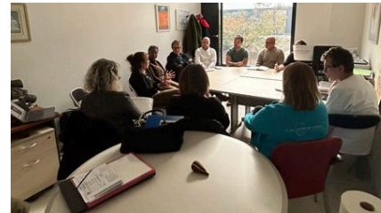
Rencontre avec des personnels soignants du nouvel hôpital de Voiron