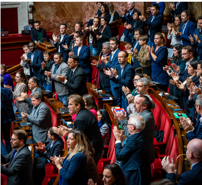
Victoire ! Nous censurons le gouvernement Barnier !