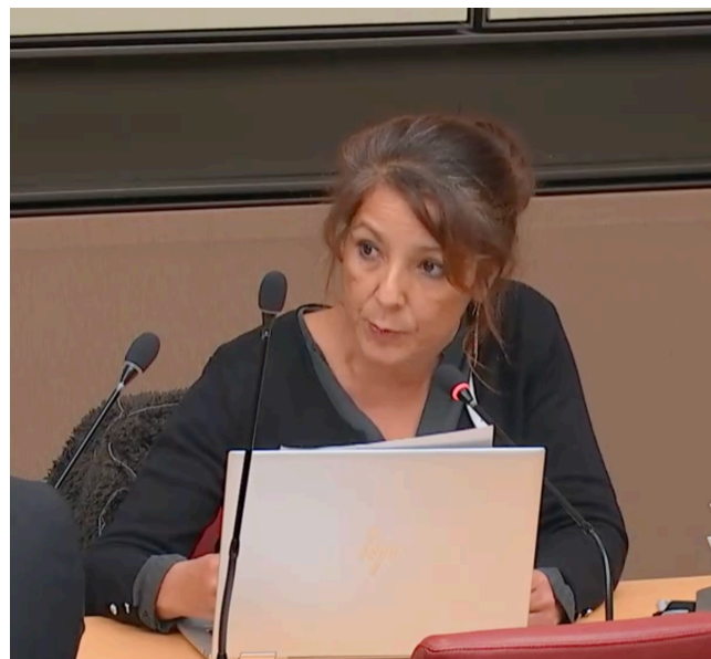
Déclaration générale en commission des affaires économiques

Je compte très prochainement déposer une proposition de loi afin de constitutionnaliser le droit au logement. Car le logement est fondamental pour le bien-être individuel et pour la stabilité sociale. Il est temps d'inscrire ce droit dans notre constitution !